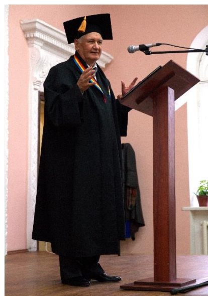
Răsouns la Laudatio